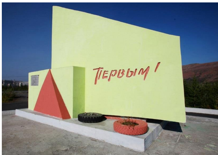
Обелиск «Первым!» (город Талнах)