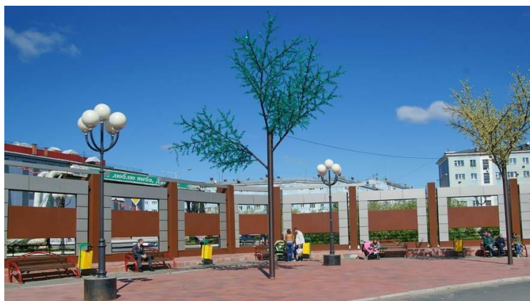
Аллея Славы (город Дудинка)