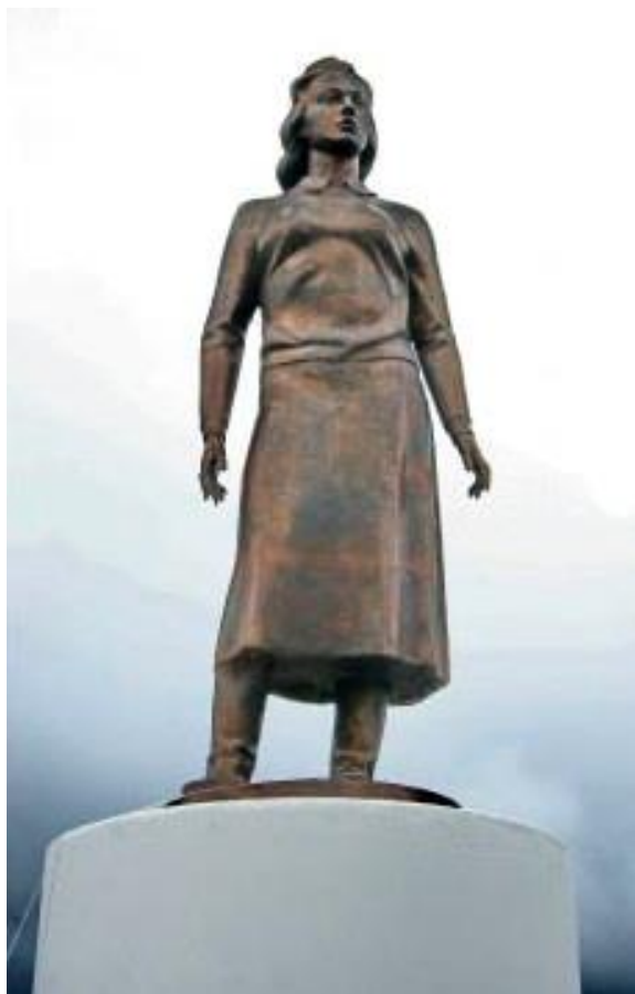
Скульптура девушки-геолога на берегу озера Долгого около города Норильска

Июль 15 лет со времени открытия мемориальной доски Евдокии Егоровне (Огдо) Аксёновой в посёлке Новорыбная сельского поселения Хатанга (2005)