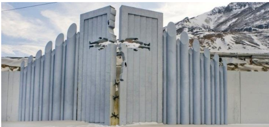
Памятник «Последние врата» (город Норильск)