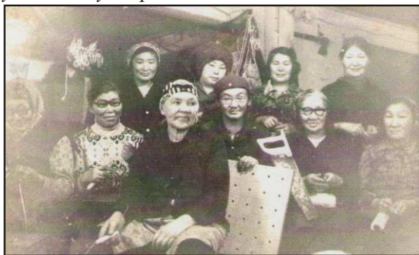
Женщины в сетной мастерской совхоза «Енисей», 1980-й год.