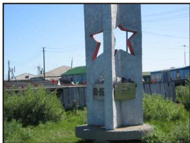
Обелиск в п. Левинские Пески

Период Великой Отечественной войны в поселке Левинские Пески – это время еще более интенсивного труда, самопожертвования, защиты Родины. Жители поселка сдавали пушнину в фонд обороны, брали повышенные обязательства по вылову рыбы.