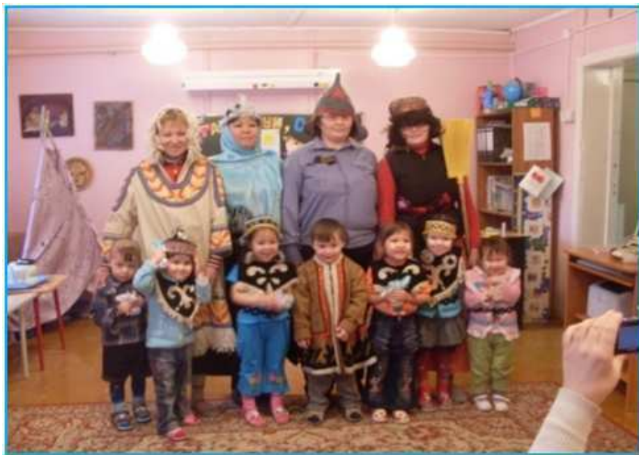
Работники культуры в детском саду, 2010г.

Поселок Левинские Пески – это наша малая родина. Она очаровательна величественным Енисеем, неброским простором тундры. В Левинских Песках живут замечательные люди – жизнерадостные и трудолюбивые. Пусть наш поселок живет и процветает.