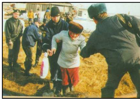
Ледоход, 1999 год.