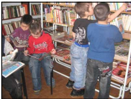
В библиотеке поселка

В 1999 году библиотека пережила трудные времена. Огромный ущерб всему фонду принес весенний паводок. Вся литература была уничтожена водой. Книжный фонд восстанавливался путем новых приобретений и безвозмездной передачи литературы из других библиотек