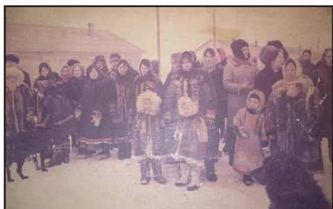
Жители поселка - 1974г.

По воспоминаниям жителей поселка, в 1960–е годы в Левинские Пески