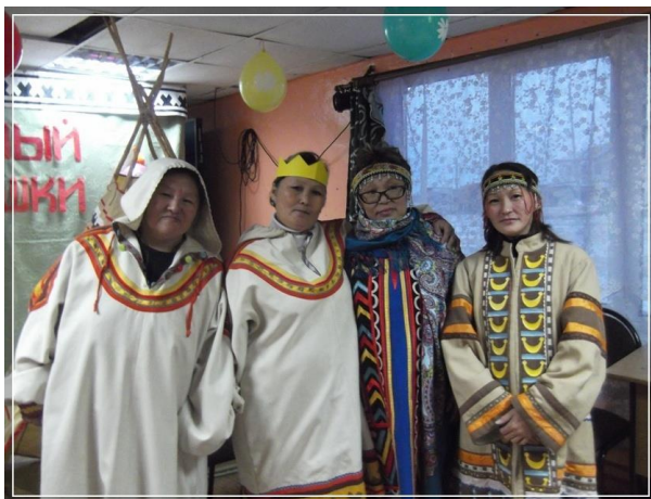
Участники сказки «Юноша-царь и дочь крестьянина»

бимым развлечением и отдыхом. И рассказывали их обычно на досуге, после трудового дня. Сегодня мы окунемся в мир долганских и нганасанских сказок: удивительных и интересных, увлекательных и познавательных. В прошлом сказки у наших народов являлись своего рода школой жизни. Молодые поколения слушали и старались подражать героям, которые прославлялись в сказках. Предлагаем вашему вниманию долганскую сказку «Юноша – царь и дочь крестьянина». Сказку представляют члены семейного клуба «Общение».