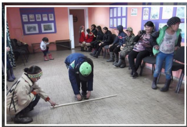
Игра «Прыжок через хорей»

Ведущий: В ходе подготовки к нашему мероприятию дети готовили рисунки по теме на конкурс. Ребята советовались с родителями, читали книги об игрушках и играх народов Таймыра. Мы подвели итоги конкурса и сейчас объявим имена победителей конкурса детского рисунка.