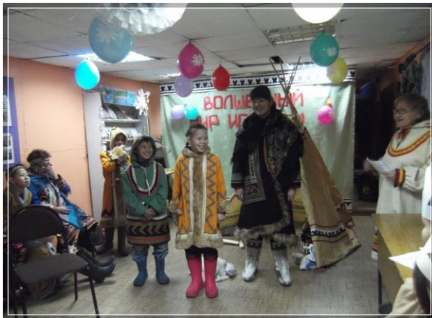
Сказка «Лучший охотник»

Ведущий: Есть у долган сказки «Хатыы олонколор». Это самый распространенный и бытующий до наших дней жанр устного народного творчества долган. Это в основном сказки о животных и волшебные сказки, где животные или люди, оказавшись в разных жизненных ситуациях, проходят испытания, принимают для себя мудрые решения. Об этом долганская сказка «Лучший охотник».