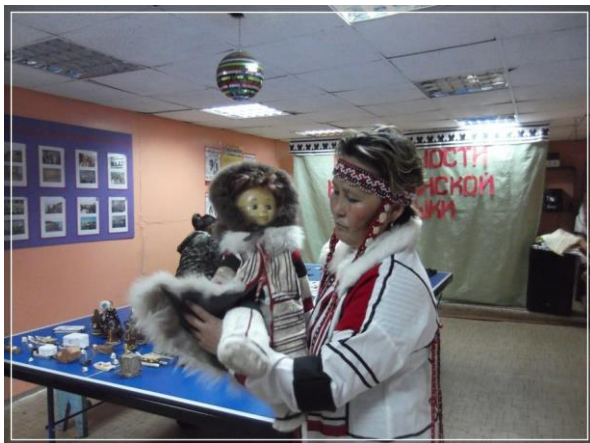
Рассказ о нганасанской одежде

Ведущий: Нганасаны, как и другие народы Таймыра, на орудия труда, одежду и утварь наносили свой орнамент. Широко применяли темный и светлый мех оленя, ровдугу, олений волос, собачий мех, сухожильные нитки, ткань, краски, кость мамонта, металл. В художественной отделке одежды нганасаны используют три цвета: черный, красный и белый. Такую окраску имеет оперение краснозобой гагары, от которой, по преданию, произошел род нганасан. Орнаменты состоят из полос, квадратов, треугольников. Орнаменты нганасан играют роль оберега. По характеру и расположению этих орнаментов можно судить о возрасте и родовой принадлежности их владельца, семейном положении, уровне мастерства, ограждении-обереге от злого умысла. Сейчас мы изготовим основанный на традициях нганасанского декоративно-прикладного искусства современный сувенир. Это могут быть куклы, кисеты, сумочки, наголовники, амулет – сими.