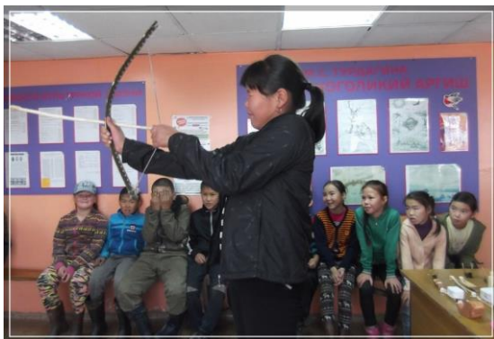
Проводится игра «Стрельба из лука»

Ведущий: Мальчики чаще всего играли в охоту . Отцы или старшие братья делали им маленькие луки и тупые стрелы к ним. Лук со стрелами изготавливали из изогнутого прута – ивняка, веревки – тетевы. Стреляли из них дети в стволы деревьев, упражняясь в меткости.