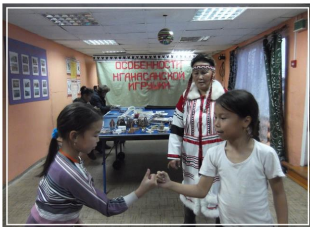
Игра «Перетягивание мизинца»

Проходят игры «Колени» и «Перетягивание мизинца».