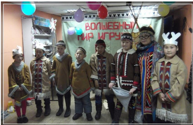
Участники сказки «Баруси»