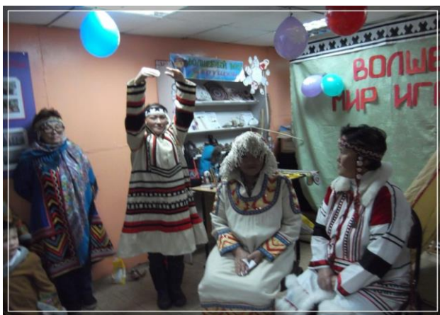
Сказка «Дяйкю» (семья Сигиз)

Ведущий: В нганасанском фольклоре есть весьма колоритный и известный персонаж – это Дяйкю. Это традиционный, юмористический образ плута и обманщика. Ради наживы прожорливый и жадный плут Дяйкю никого не щадит: он пакостит родным и близким, старикам и детям. Он изворотлив, хитер и прозорлив. Объектами его небезобидных шуток и проделок становятся чаще всего глупые и слишком легковверные люди. Посмотрите сказку из нганасанского фольклора «Дяйкю».