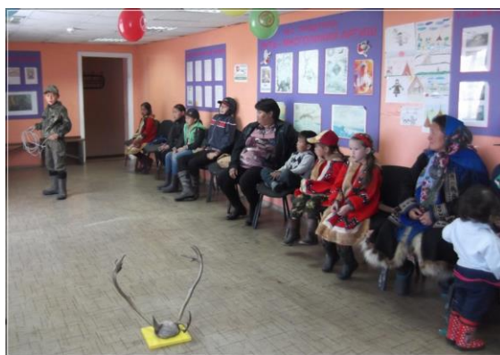
Игра «Метание маута»

Ведущий: У нас очень популярной игрой пользуется игра в «лани».