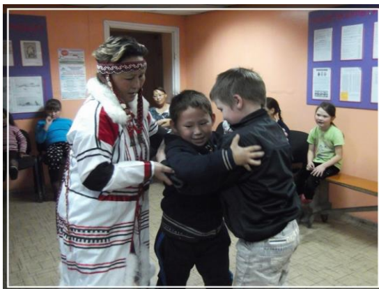
Нганасанская борьба «Торамбса»

Ведущий: В ветреную погоду дети бегали по площадке с игрушкой «Херы» - вертушка. Отцы изготавливали вертушки для своих детей из дерева. Игрушка состоит из основания – струганой палочки и лопасти, которая вращается от ветра.