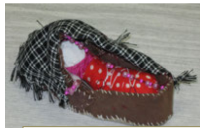
Колыбелька из картона.

Колыбелька сделана из картона, дужкой послужила грудная кость птицы. На дугу сверху накидывается платок или кусок лёгкой ткани для предохранения ребёнка от мух и комаров.