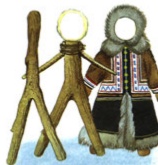
Кукла из природного материала – дерева.

Остовом (основой) служил сучок 15 - 20см. с развилкой. Конец сучка закругляли – получалось что – то на подобии лица, а развилка изображала ноги. Для наряда служили обрезки меха и кожи, сукна.