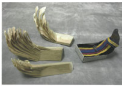
Упряжка из трех оленей.

Олени изготовлены из стружки для разжигания.