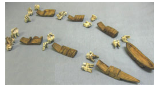
Аргиш из грузовых и легковых нарт.

Изготовлена из зубов оленей и маленьких нарт, вырезанных из дерева.