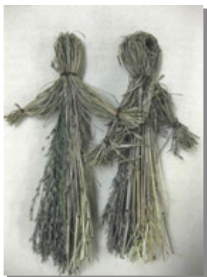
Кукла из соломки.

соломки. Для этого солому одинаковой длины собирают в пучок (не толще 4-6см.) сгибают пополам и немного отступив от верхушки (приблизительно 2см.), пучок перехватывают не – только раз крепкой травой или ниткой. Это голова. Затем с обеих сторон пучка отделяют по небольшой его