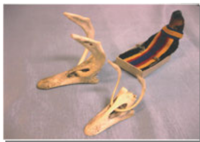
Упряжка из двух оленей.

Оленями служат клювики и грудная часть птицы, вдетая в носовые отверстия клювиков. Хозяин – ненецкая кукла.