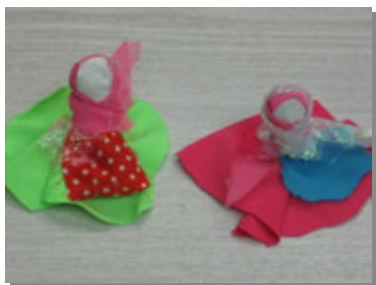
Кукла из лоскутков ткани.

Для её изготовления брали лоскут ткани, складывали в несколько рядов, туго сворачивали верхнюю часть, которая будет головкой, всё остальное – туловище. Из кусочка ткани вырезали косынку (платок) и повязывали голову куклы,