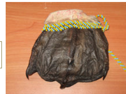
Детская сумочки из лапок лебедя.

сукна и меха, бисер, бусинки, птичьи клювы, сухожильные нитки.