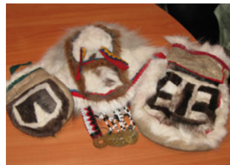
Сумочка из оленьего меха.

Сумочка из оленьего меха, украшенная меховым орнаментом разных оттенков и полосок сукна. В этих сумочках хранились лоскутки