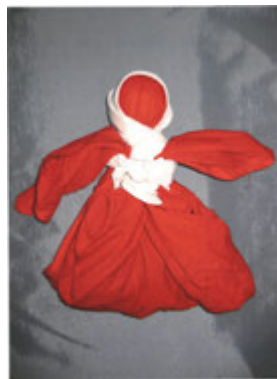
Кукла из ткани.

Для работы использовали различные кусочки ткани. Ткань закручивали в жгут, к которому пришивали руки и ноги. Из ниток и тонко нарезанных лоскутков плели косички.